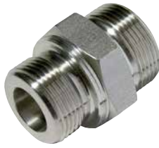
GE.M [Pos. 1]