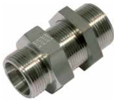
GSV [Pos. 1+6]