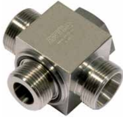
TSKV [Pos. 1+5-7]