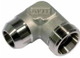
WAV [Pos. 1]