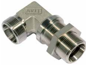
WSV [Pos. 1+6]