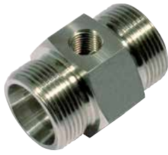
DEV [Pos. 1]