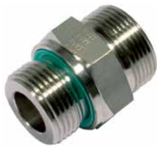
GU. [Pos. 1+5]