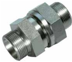
RV [Pos. 1]